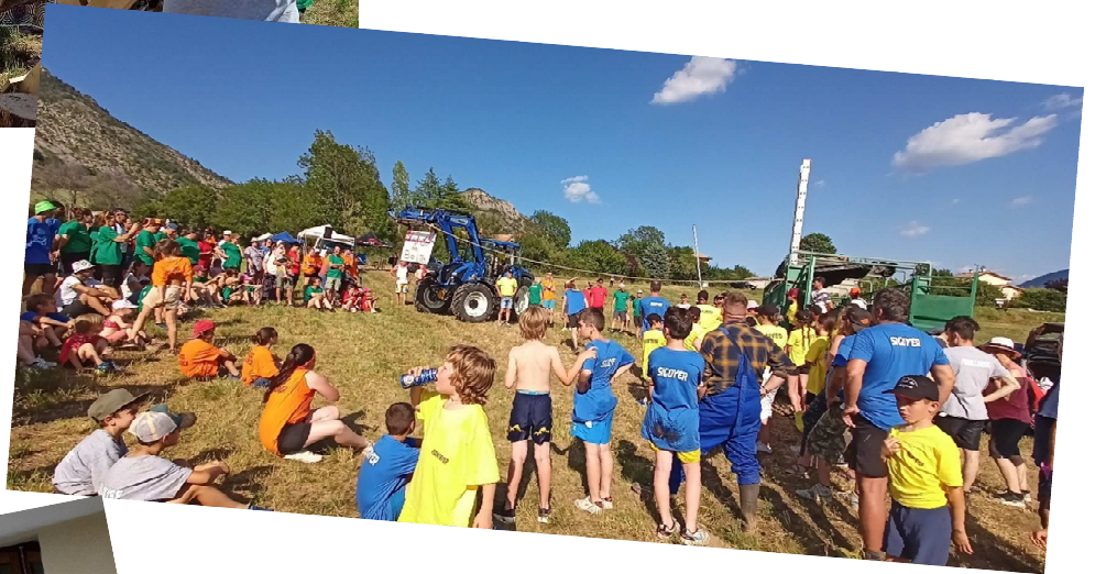
Soupe aux Jeux Janvier

Sigoyer vainqueur chez les adultes et Fouillouse vainqueur chez les enfants