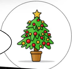
Noël des enfants à la Patinoire