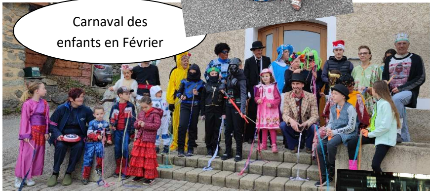
Carnaval des enfants en Février