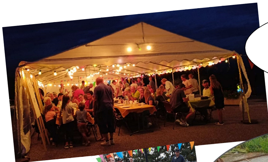
Fête du Village 29 août 2023 Concours de pétanque, boules carrées Plus de 80 personnes ont participé au repas qui a clôturé la journée